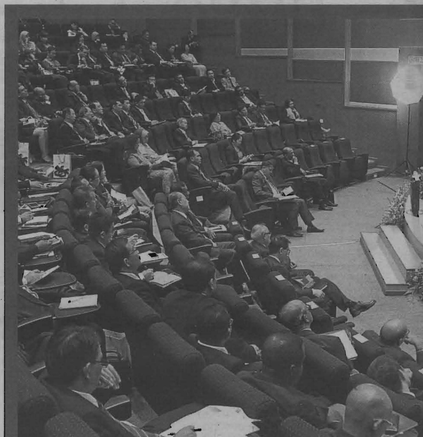
Antara yang hadir pada Simposium Antarabangsa Keselamatan 2013 di Institut Diplomasi dan Hubungan Luar Negeri (IDFR), baru-baru ini.

Sebaliknya, ia lebih suka berdiplomasi dan sedaya upaya cuba bersikap memahami apa juga ma-